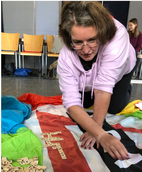
Was verbindest du mit dem CVJM? Mit unterschiedlichen Methoden näherten wir uns spielerisch dem Thema des Tages.

Ende Oktober haben sich ca. 30 Mitarbeiterinnen und Mitarbeiter für einen ganzen Samstag im CVJM-Haus getroffen, um miteinander Gottesdienst zu feiern, Gemeinschaft zu erleben, zu singen, zu spielen und um miteinander zu beraten, wie die Arbeit unseres Vereins in Zukunft aussehen kann.