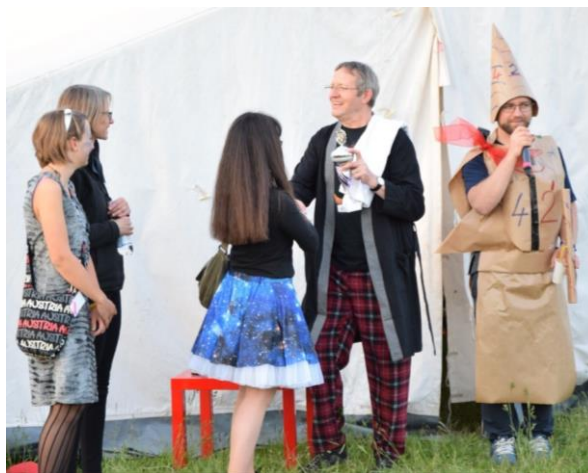
Preisverleihung beim Marktfest