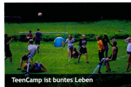
TeenCamp ist buntes Leben