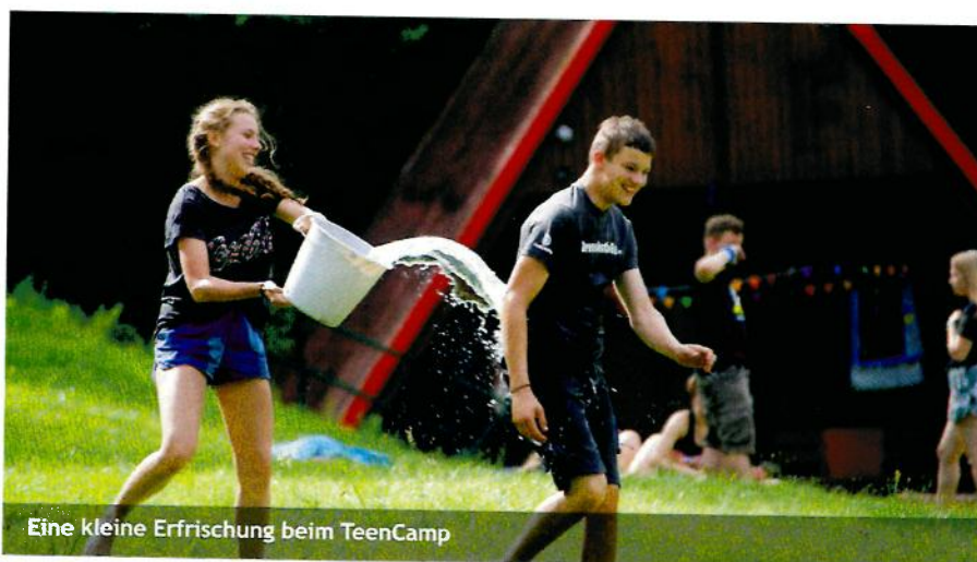
Eine kleine Erfrischung beim TeenCamp