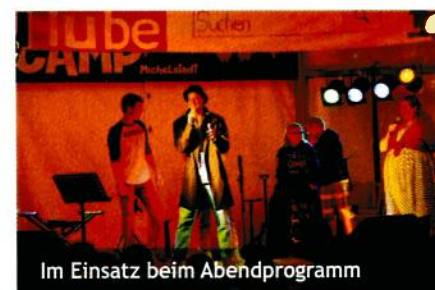
Im Einsatz beim Abendprogramm