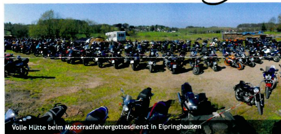
Volle Hütte beim Motorradfahrergottesdienst in Eipringhausen